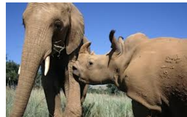
Dinheiro arrecadado através de crowdfunding custeia medidas protetivas de espécies ameaçadas, como o elefante africano e o rinoceronte negro.

A pesquisa completa sobre os benefícios do financiamento coletivo na manutenção da biodiversidade global pode ser encontrada aqui (https://onlinelibrary.wiley.com/doi/abs/10.1111/cobi.13144).